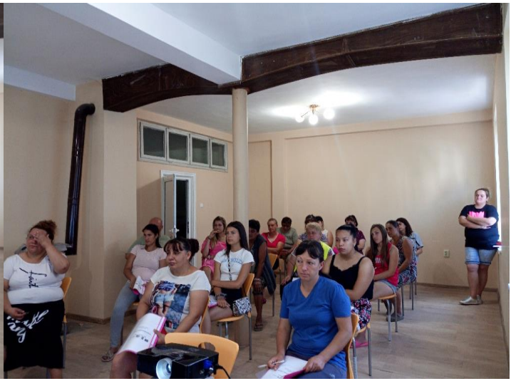
21.07.2022 г., с. Дерманци, община Луковит, сградата на НЧ „Христо Ботев-1895г“